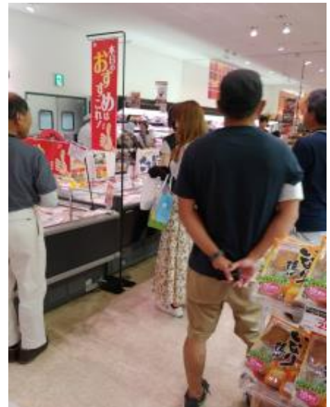
非行防止啓発活動（8月）