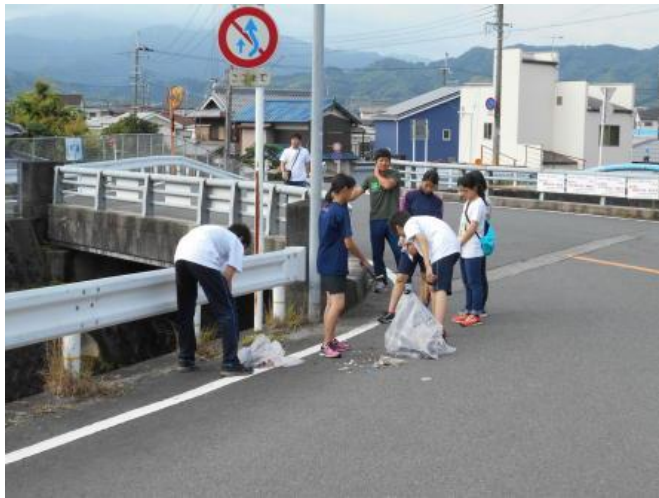
田原川とその周辺の美化活動（7月）