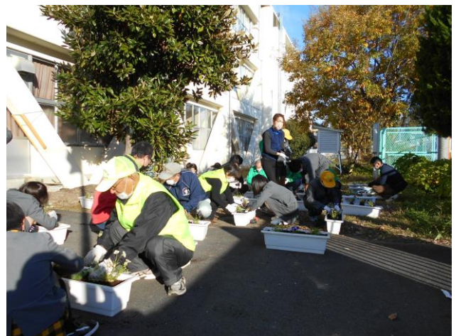
11月 学校での花植え交流会