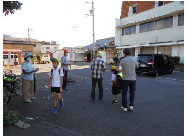
9月 朝の声かけ挨拶運動