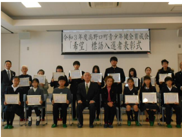
12月 希望標語の入選者表彰