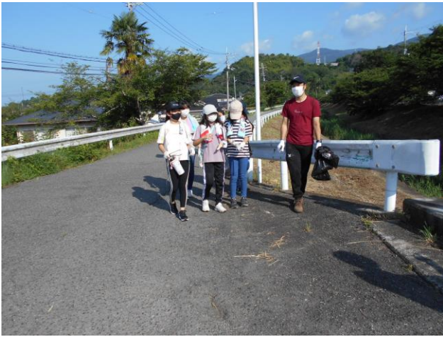
7月 田原川とその周辺の美化活動