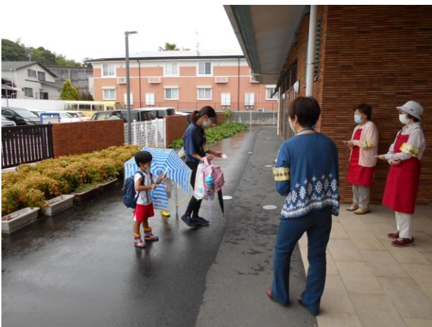
10月 朝の声かけ挨拶運動