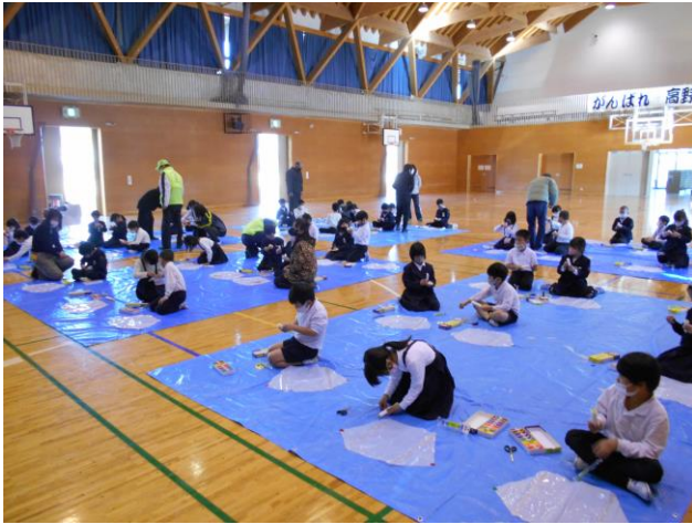
1月 たこ作りたこ揚げ会（高野口小）