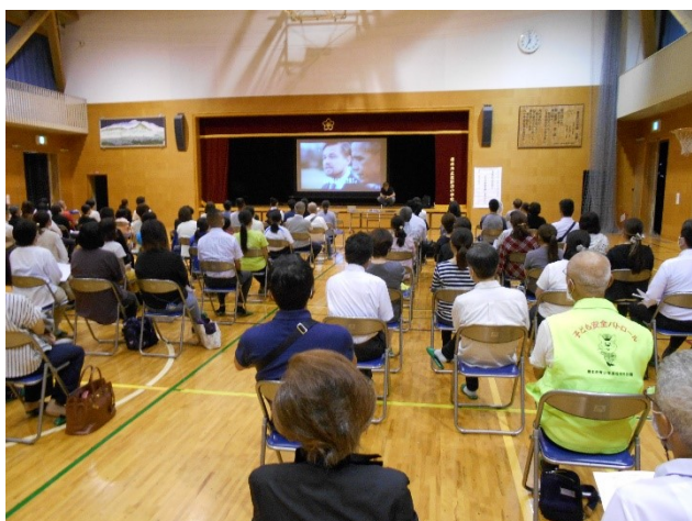
9月 教育講演会（高野口小体育館）