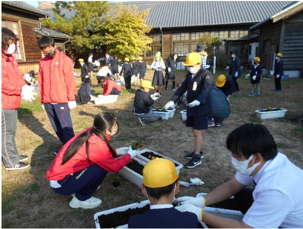
1 1 月 学校での花植え交流会（高野口小）