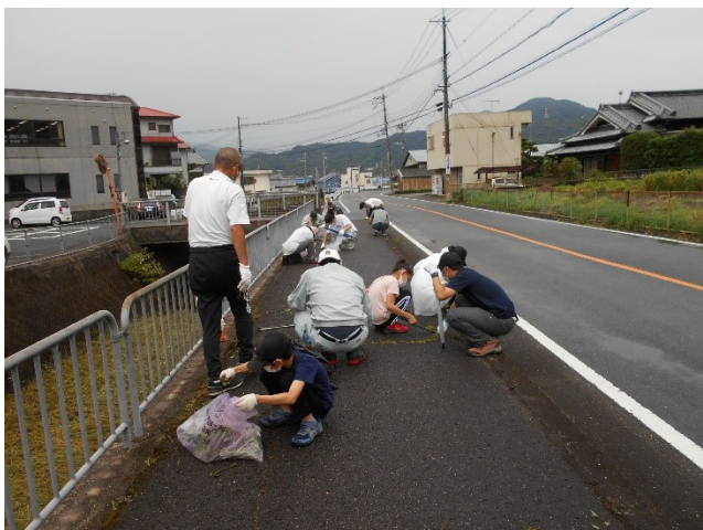
7月 田原川とその周辺の美化活動