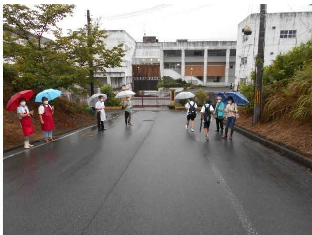
9月 朝の声かけ挨拶運動（高野口中）