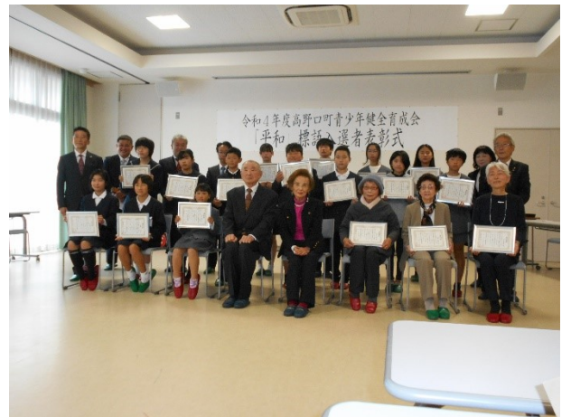
1 2 月 平和標語表彰式（公民館）