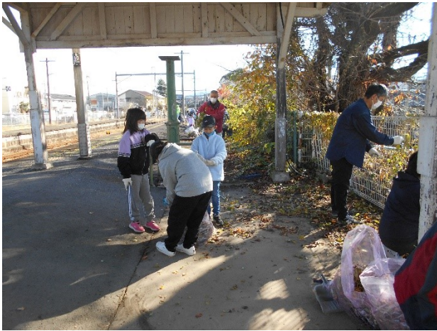
1 2 月 JR 高野口駅の美化活動