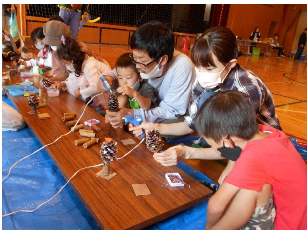
10月 ちびっこ広場事業（高野口小体育館）