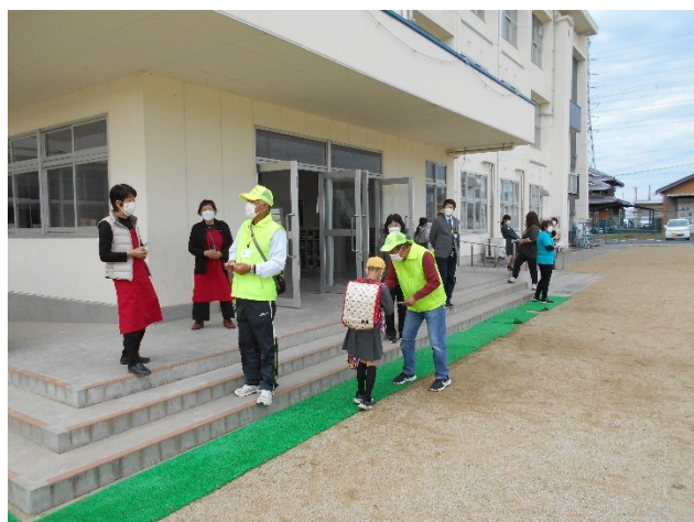
10月 朝の声かけ挨拶運動（応其小）