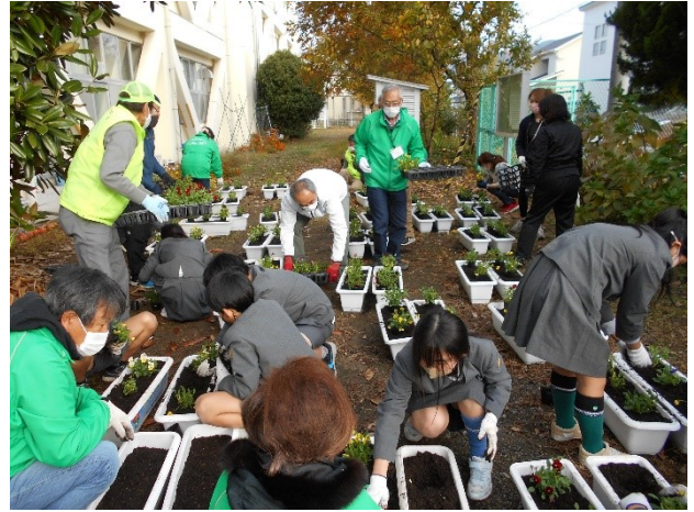
1 1 月 学校での花植え交流会（応其小）