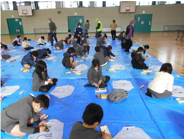
1 月 たこ作りたこ揚げ会（応其小）